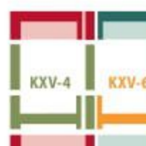
Комплекс из 4-х окон B2/2