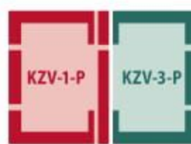
Комплекс из 2-х окон B2/1