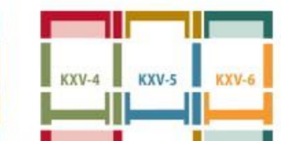
Комплекс из 6-ти окон B3/2