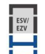
Комплекс из 2-х окон B1/2